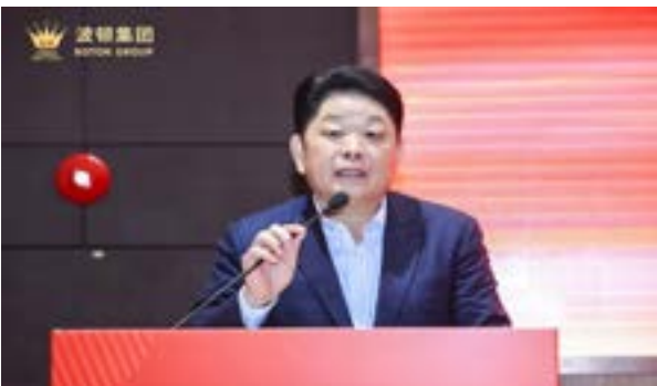
全国政协委员、福建省政协常委许明金作分享