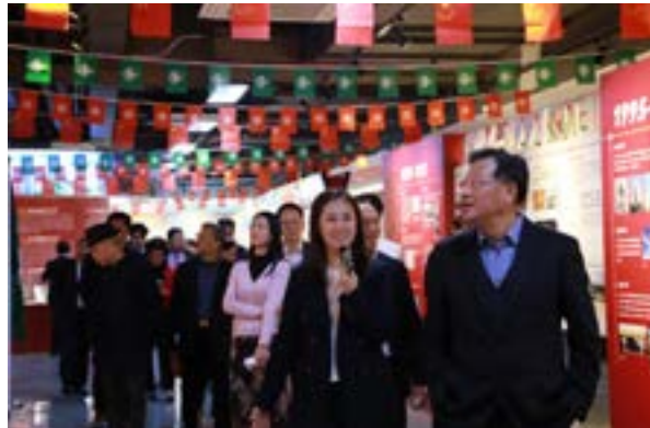
广东省政协原副主席、中心理事长林雄一行参观展厅