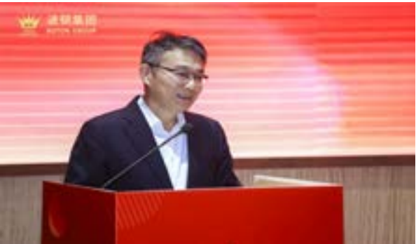
深圳市南山区政协党组书记、主席郑崇阳讲话