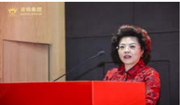
全国政协委员、黑龙江省工商联副主席周春玲