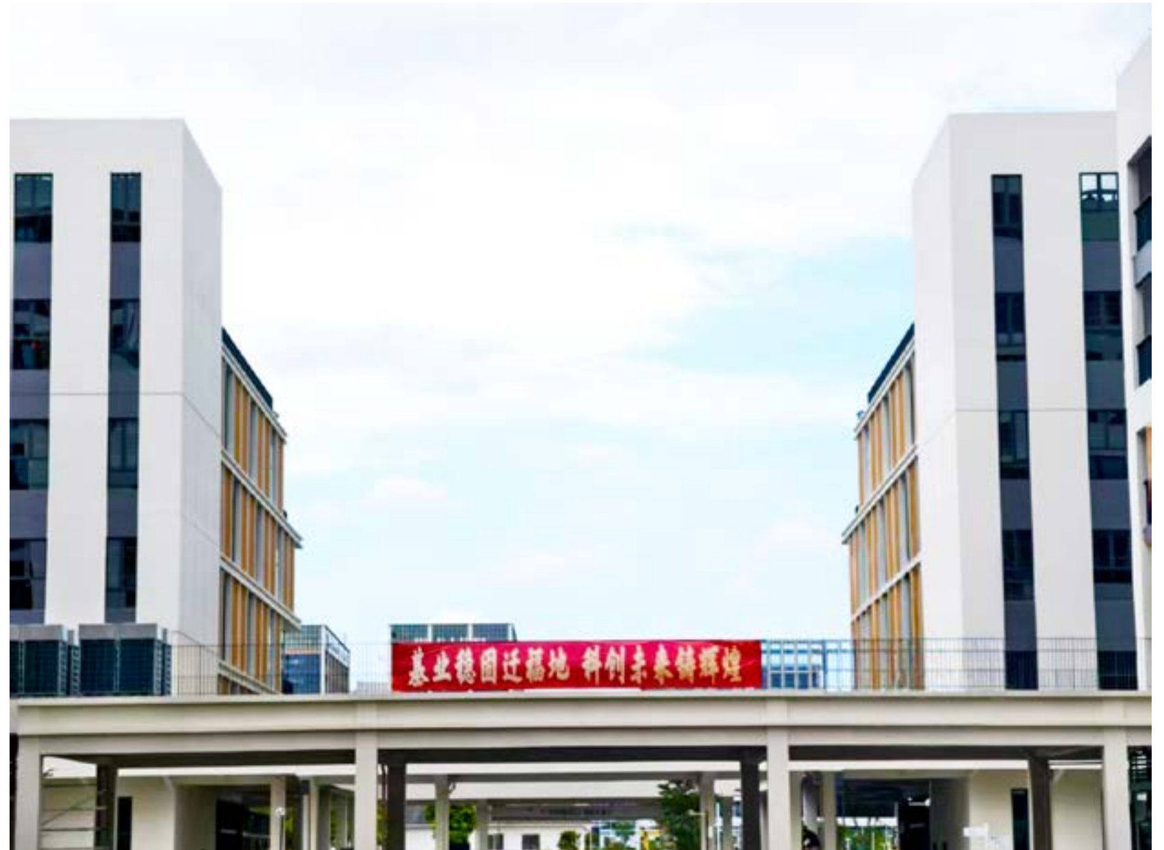
集团 黄嵩恒 摄影作品《基业稳固迁福地 科创未来铸辉煌》