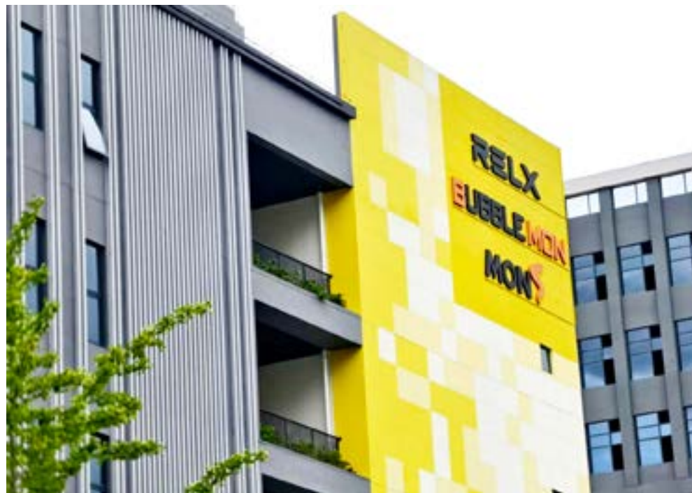
集团 黄嵩恒 摄影作品《黄墙承香》