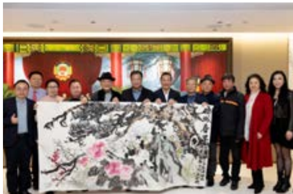
主创人员及领导嘉宾合影

2025年2月23日，广东省国际文化交流中心（以下简称：中心）春茗活动在波顿集团总部大楼隆重举行。广东省政协原副主席、中心理事长林雄以及来自粤港深莞四地部分理事共40多人参加活动，中国波顿集团董事长兼总裁王明凡先生与大家欢聚一堂，共叙情谊，共谋新篇。