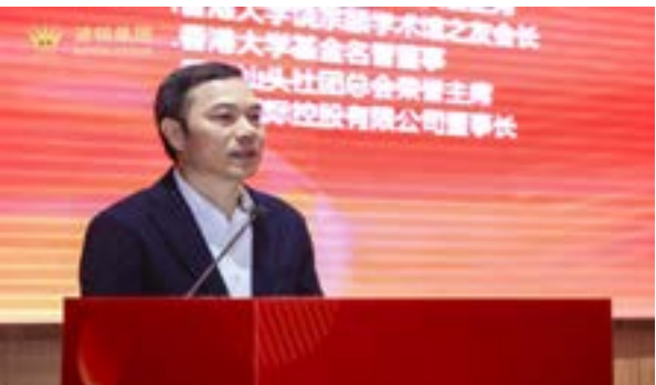
全国政协委员、香港广西社团总会首席会长王明凡作分享