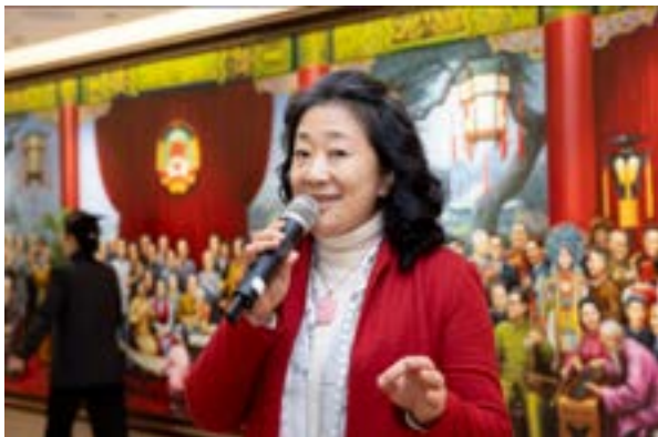
知名歌唱家在现场一展歌喉