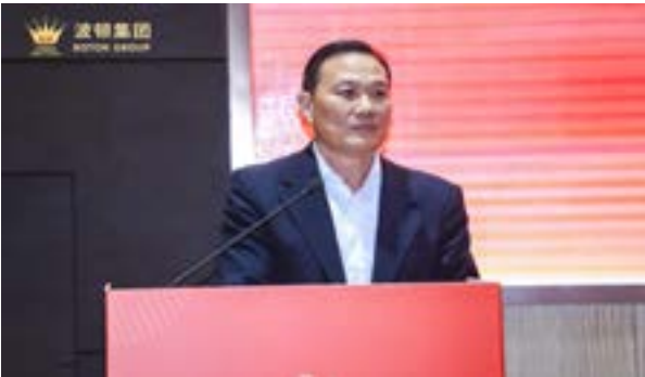
全国政协委员、香港工商总会会长陈文洲作分享